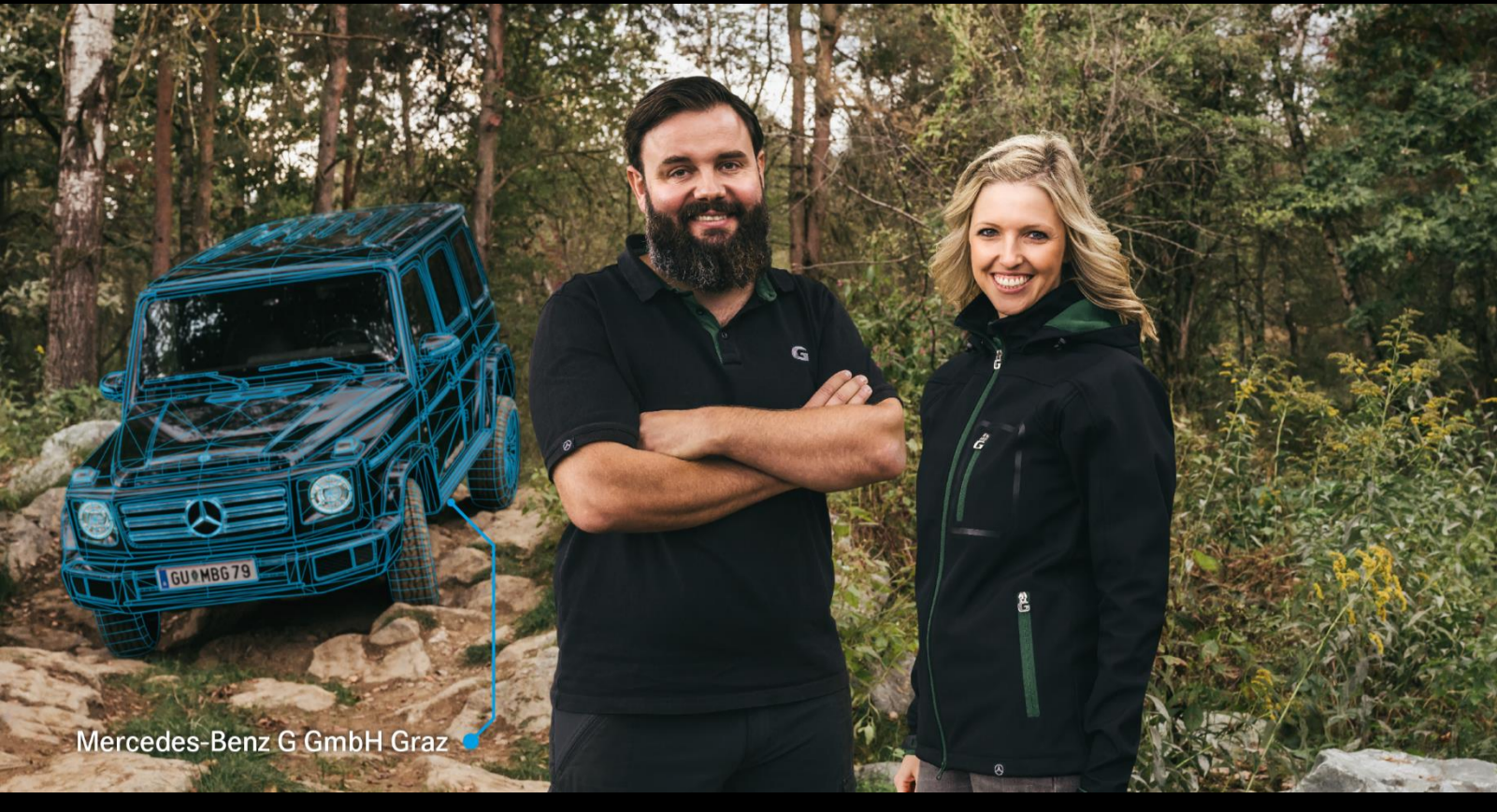
Mercedes-Benz G GmbH Graz