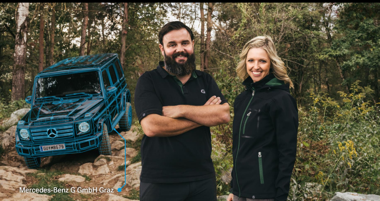
Mercedes-Benz G GmbH Graz